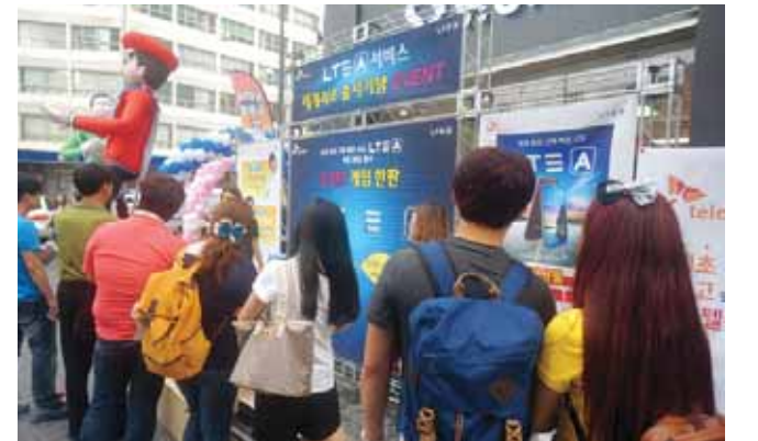
SK텔레콤은 최근 총장로에서 세계 최초 2배 빠른 LTE서비스인 LTE-A 출시기념 이벤트를 진행하고 7월말까지 구입고객 전원에게 경품추첨 및 사은 혜택을 제공할 방침이다.