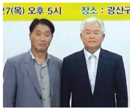
이 경제 민주화 성공에 밑거름이 될 것”이라고 강조했다. /양세열기자hot@

민경제가 위협 받고 있다”며 “국민석유 주식회사를 설립해 현재보다 20% 저렴한 석유를 공급하겠다”고 밝혔다. 국민석유 주식회사는 지역별 운동을 전개하기 위해 광산지역 위원회 창단을 준비해왔다. 정부 승인은 허가가 아닌 등록만 하면 되기 때문에 승인이 끝나면 즉시 석유공급에 나설 수 있을 전망이다. 강경환 대표는 “국민석유 주식회사의 안착