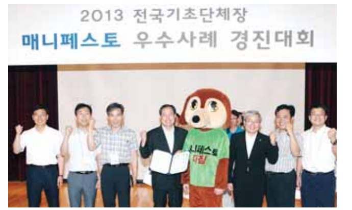
2013 전국기초단체장 매니페스토 우수사례 경진대회. 광주시 동구구청장이 (사)한국매니페스토 토론회본부 주최로 열린 2013년 민선5기 전국기초자치단체장 매니페스토 경진대회에서 광주시 북구가 109개 자치단체 중 공약 이행분야에서 2년 연속 우수상을 수상했다.