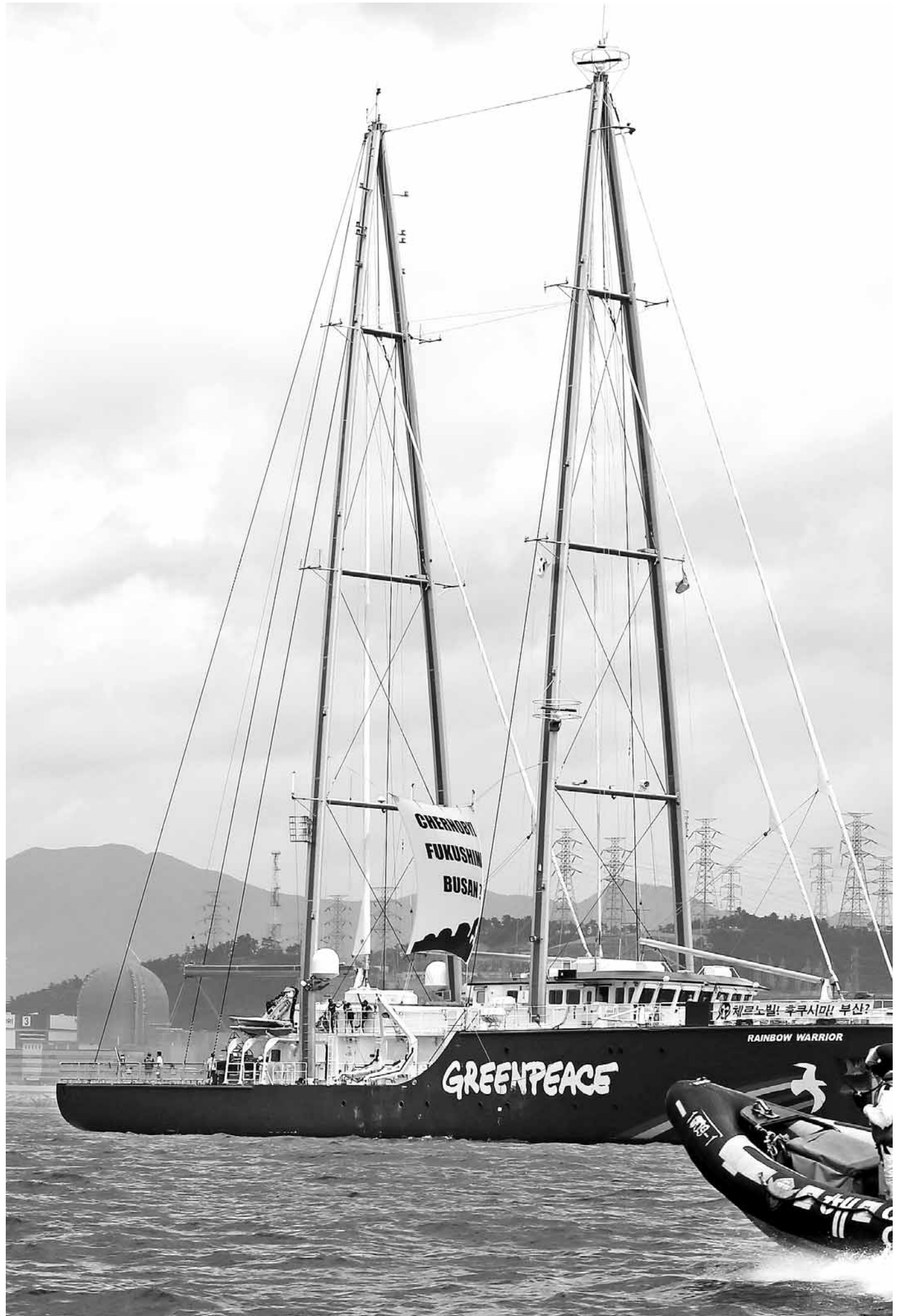
지난 15일 부산 기장군 고리원자력 발전소 앞 500여m(원자력 안전법예의한 접근금지 구역)지점에서 그린피스 소속 '레인보우 워리어'가 탈핵을 주장하는 문구를 걸고 해상 캠페인을 벌이고 있다.