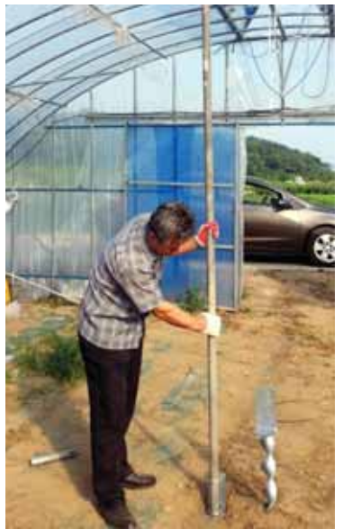
해남군 옥천면 한 농민이 태풍에 잘 견딜 수 있는 하우스 보강 지주를 설치하고 있다.