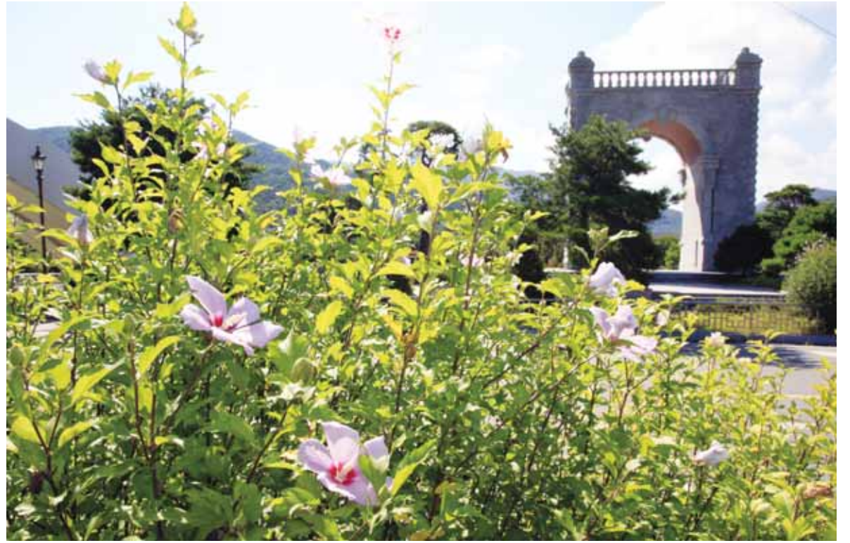
내일 광복절... 독립문 앞에 핀 무궁화

광복절을 하루 앞둔 14일, 보성군 문덕면 서재필 기념공원 주변에 무궁화가 활짝 피어 눈길을 끌고 있다.