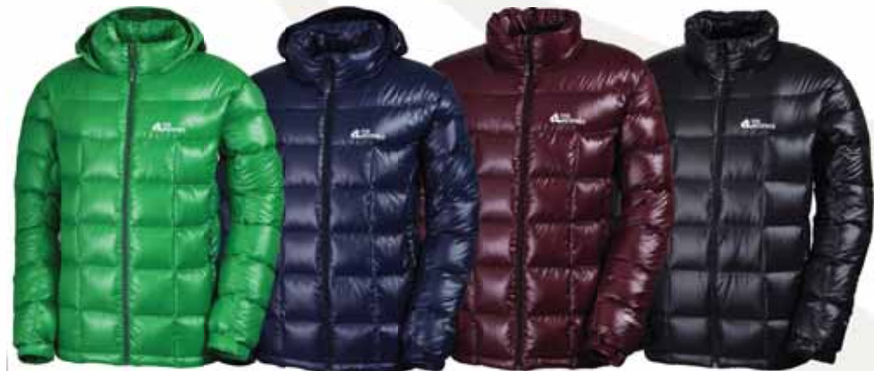
퍼텍스 구스 재킷 그린, 네이비, 버건디, 블랙 170,000원