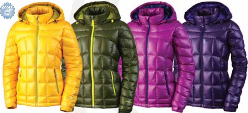
퍼텍스 구스 우먼 재킷 옐로우, 그린, 핑크, 퍼플 170,000원

레드페이스의 구스다운 재킷은 최상급 프리미엄 구스다운 (솜털과 깃털의 비율 90:10 / FILL POWER-850)과 퍼텍스사의 마이크로 라이트 소재를 사용하여 뛰어난 방풍성과 보온성이 우수한 매우 가벼운 거위털(구스다운) 재킷입니다.