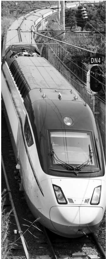
서울과 목포를 잇는 호남고속철도에 투입될 새 고속열차 1호가 21일 제작사인 경남 현대 로템 창원공장에서 첫 시험운전에 들어갔다.