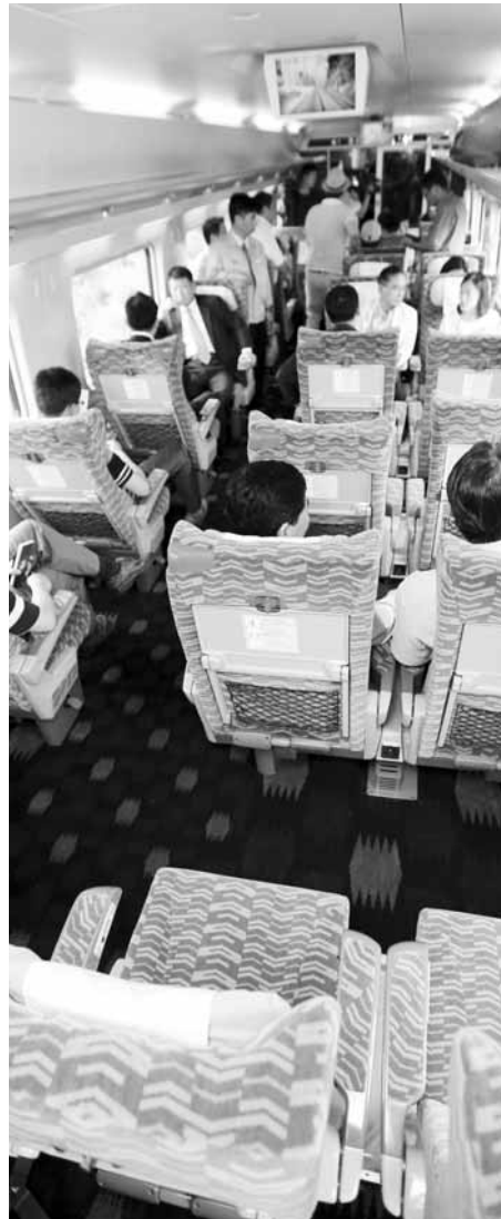
호남고속철에 투입되는 새 열차는 좌석공간이 충분하고 소음이 적은 점이 특징이다. 사진은 새 열차 특실 내부. /연남뉴스

시속 300km의 호남고속철이 시운전을 거쳐 2015년 투입되면 서울에서 목포까지 걸리는 시간은 2시간 5분으로 지금의 3시간 11분보다 1시간 6분 단축된다. /연남뉴스