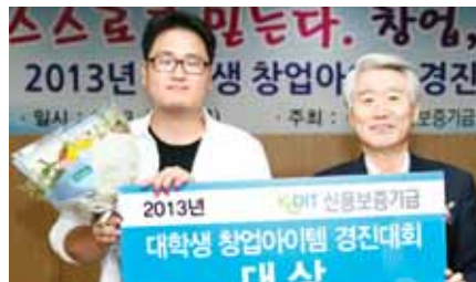
2013년 창업아이템 경진대회 수상자들.

해 창의적이고 생동감있는 공연을 선보였다는 평가를 받았다. 2011년 창단한 담양건강난타예술회는 회원들의 평균 연령이 65세가 넘고 최고령자는 74세다. 이들은 매주 월·수·금 저녁 시간에 담양문화회관에서 열리는 건강난타교실에 참여해 꾸준한 연습을 통해 실력을 쌓으며 건강도 지키고 있다. 이 단체는 특히 지난해 열린 제3회 환경소리축제 담양전국국악대전에서 특별상 수상에 이어 지역행사에 참여해 노인들을 과시하고 있다. /담양=정재근기자 jgg@