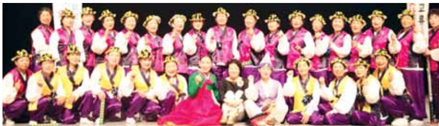
제34회 무궁화예술제에서 대상을 수상한 담양건강난타예술회 회원들.

피와 땀으로 일군 민주주의에 대해 언론이 지키려고 하지 않고 오히려 뒷걸음치게 하고 있다며 각성을 촉구했다. 기자이자 교수로서 후배들에게 ‘매서운 조언’을 아끼지 않았던 그는 원래 교사가 되고 싶었다고 말했다. 글쓰기를 좋아했던 ‘청년 송정민’은 군부독재정권이 민주화를 짓밟는 것을 보며 참을 수 없었다. /양세열기자 hot@kwangju.co.kr