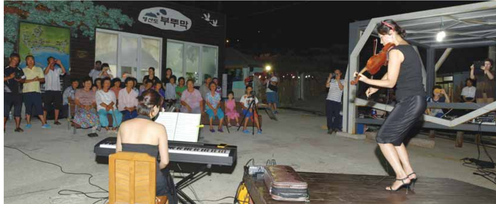
찾아가는 클래식 음악회 신안문화원이 최근 흑산면 영산도에서 개최한 ‘영산도 찾아가는 클래식 음악회’에서 연주자들이 바이올린 협연을 하고 있다. 신안문화원은 올해 전남문화예술재단의 지원을 받아 ‘2013 영산도 명품선마을 사람들의 그림이야기’ 프로그램을 진행해 오고 있다.

무안군은 28일 “효행(孝行) 문화 장려 등을 위해 30일까지 4대 이상 거주 가족에 대한 효행수당 신청을 접수한다”고 밝혔다. 무안군은 지난해 말 효행장려수당 지급 조례를 제정한 바 있다. 광주와 전남지역에서 4대 한지붕 거주 가족에게 수당을 지급하는 것은 처음이다. 대상은 신청일 현재 4대 이상이 무안군에 1년 이상 주소를 두고 함께 거주하는 가정이다. 오는 추석 명절을 앞두고 30만원씩 지급한다. /무안=김민준기자 jun@