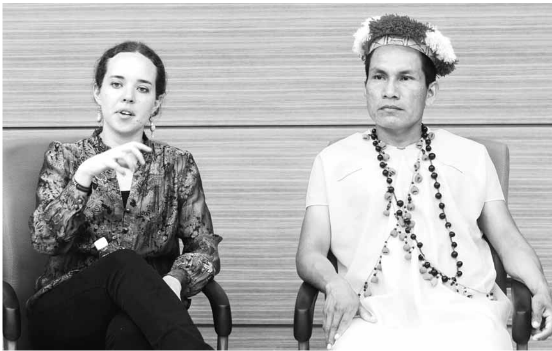
지난 27일 전남대에서 열린 '광주, 생명의 땅 아마존을 만나다' 특강에서 베네수엘라(왼쪽)변호사와 에더 족장이 광주 시민들에게 아마존 파괴 실태를 설명하고 있다.