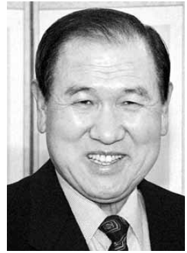
노태우 전 대통령

이들 3자는 노씨의 미납 추징금을 신씨와 재우씨가 대납하는 대신 노씨는 이들에 대한 각종 채권을 포기하