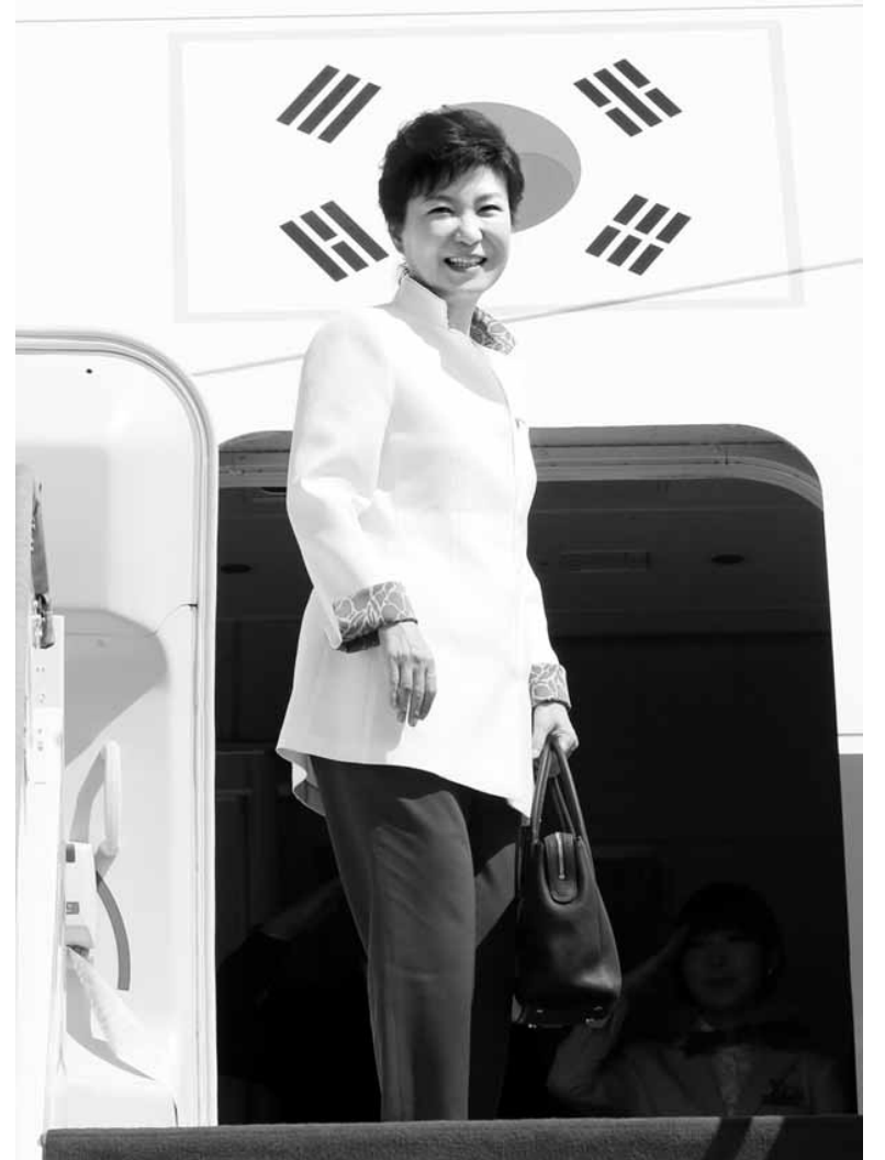
박근혜 대통령이 러시아에서 열리는 G20(주요 20개국) 정상회의 참석과 베트남 국민방문을 위해 4일 경기도 성남시 서울공항에서 출국하며 환송인사들에게 인사하고 있다. 연광뉴스

검찰은 "자금이 건넨 시기가 1990~1993년이라 230억 외에 더 넘어간 돈이 있는지 자금 추적을 했으나 확인하지 못했고 230억원은 대여금이라는 확정판결이 있어 혐의없음 처리했다"라고 설명했다. 연광뉴스