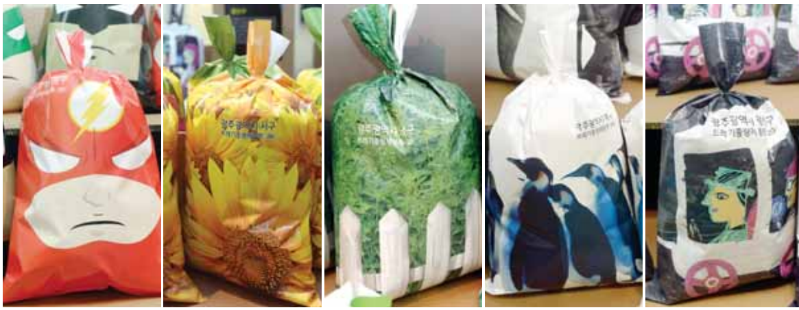
광주시내 5개 구청의 특성을 살려 제작한 쓰레기 봉투. 왼쪽부터 동·서·남·북·광산구 순.

◇콩다공 어린이집 = 어린이집 환경과 콘텐츠를 제안하는 전시다. 박자일씨는 가장 일반적인 공공립 어린이집의 보육실 면적인 160㎡에서 구성 가능한 규모를 가정해 기획했다. 전체 보육실 면적을 또 다시 7개 흥미 영역별로 구분하고 각 영역별로 활동 프로그램에 따른 이야기 전개