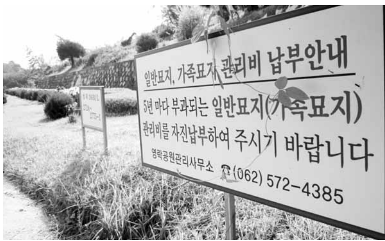
10일 광주시 북구 효령동 영락공원 묘역 입구에 관리비 자진납부를 요구하는 안내 간판이 설치돼 있다.

이에 따라 광주시도시공사는 각 묘역 입구 등에 관리비 납부를 요구하는 안내 간판과 현수막을 설치해 관리비 자진납부를 독려하고 있다. 해마다 두 차례 이상 묘지 신청자