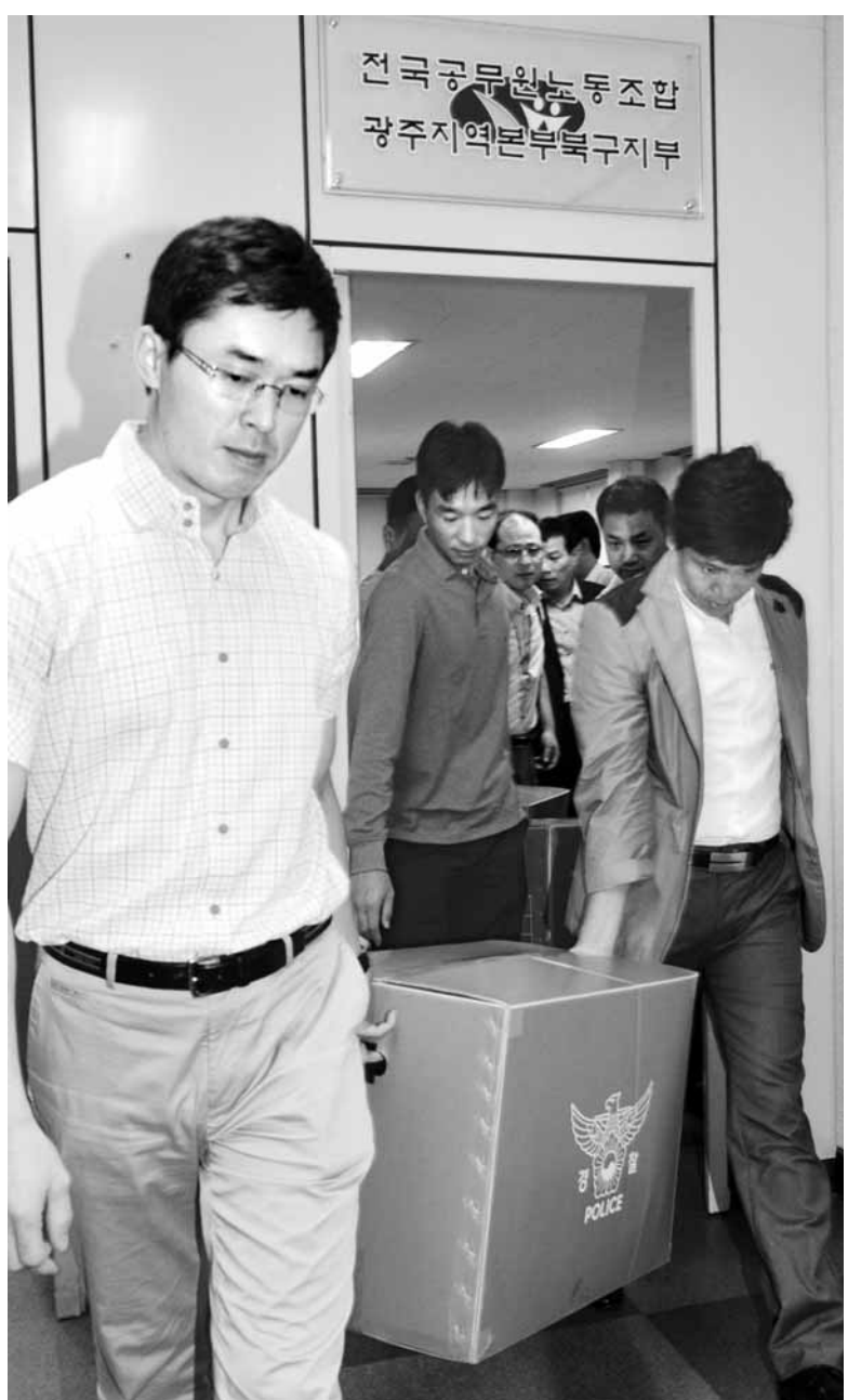
'귀태' 압수수색 광주북부경찰이 10일 귀태(鬼胎) 현수막을 제거하고 을지연습의 문제점을 지적하는 유인물을 배포한 광주 북구청 공무원노조사무실을 압수수색한 뒤, 압수물품을 옮기고 있다.

주소지로 납부 안내문을 보내는 등 체납액을 거둬들이는 등 안간힘을 쓰고 있다. 광주 영락공원관리사무소 관계자