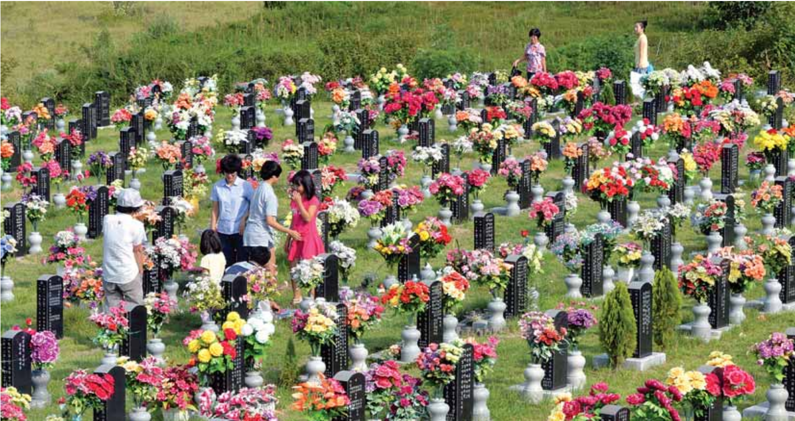
16일 광주시 북구 효령동 영락공원 묘지에서 시민들이 추석을 앞두고 미리 성묘를 하고 있다. 광주시는 추석 연휴동안 영락공원에 임시주차장을 운영하고 시내버스를 증차운행키로 하는 등 성묘객 편의를 위한 대책을 마련했다.

추석연휴기간 중 응급환자의 진료 위해 광주시내 5개 자치구 보건소가 비상진료를 실시한다. 대학병원을 비롯한 당직의료기관 534개소와 당번약국 471개소가 문을 연다. 또한 119로 전화하면 응급환자 이송은 물론 병원 응급실 운영 여부 등의 정보도 얻을 수 있다.