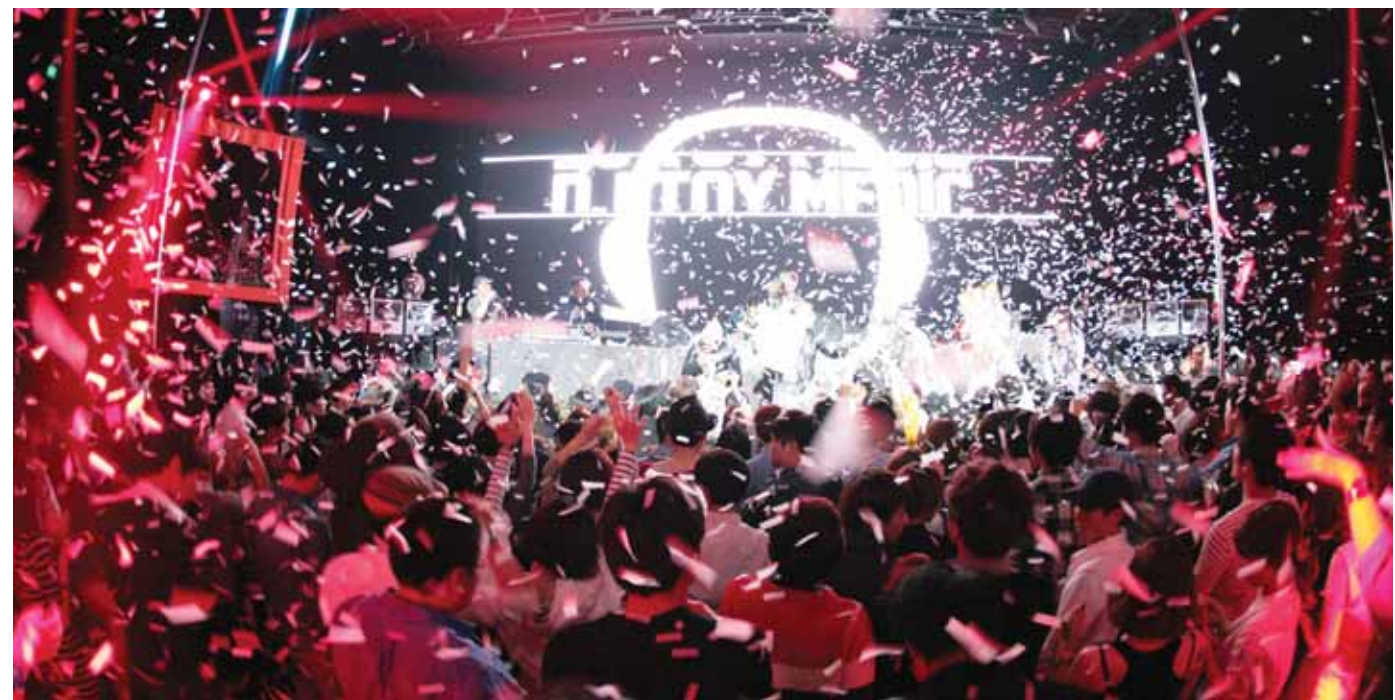
지난 3월 광주의 한 클럽에서 공연중인 파티에니멀.

청해 잠시 열광하다가 끝나버리곤 했다. 류 대표는 '모두가 즐길 수 있는 모두의 무대'를 꿈꿨다. 파티에니멀의 첫 번째 도전은 대성공이었다. 지난 2012년 9월 조선대학교 축제에 초대된 파티에니멀은 가수 DJ DOC가 왔을 때 5000여 명이 모였으니 500명만 모여도 다행이라는 주변의 시선에 크게 신경 쓰지 않았다. 그리고 1만5000명이 넘는 인파로 축제관계자들을 놀라게 했다. 이를 시작으로 호남대(2012년 11월), 원광대·울산대(2013년 5월), 동신대(9월), 광주대·제주한라대(10월) 축제에 참여했다. 대학축제를 통해 가능성을 확인한 류 대표는 이제 일반 시민과 공감할 수 있는 총장축제에 설 예정이다. 류 대표는 “7080총장축제가 10회를 맞이하며 어느 정도 안정됐지만 더 많은 시민이 참여하는 축제가 되기 위해서는 젊은이들이 좋아할 수 있는 콘텐츠가 필요하다”며 “이번 총장축제를 통해 클럽보다 더 재미있는 무대를 만들겠다”고 말했다. 이어 “저희 무대가 지역 청년들에게 긍정적인 자국이 되길 바라며 앞으로도 건전한 놀이문화를 만들어 나갈 것”이라고 밝혔다. /양세열기자 hot@