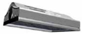
㈜케이엘텍의 고효율 고투도 LED보안등

광주테크노파크(원장 유동국)가 지난 11일 지역 중소기업 우수 제품의 마케팅 지원과 도시 브랜드 가치 제고를 위해 추진 중인 광주시 공동브랜드 MIG의 적용 제품으로 케이엘텍(대표 박경일), ㈜더블유케이(대표 임남균), ㈜에이치케이테크(대표 오승근), ㈜유양라이팅(대표 정대진) 등 4개사의 19개 제품을 추가 선정했다. 이번 선정된 4개사는 LED부품 및 LED 조명 등의 제조와 판매를 주력사업으로 하는 지역의 대표적인 LED 전문기업들로, 승인된 제품으로는 케이엘텍의 일체형 알루미늄 히트싱크 외함 방열판 적용 및 컨버터 PWM(Pluse Width Modulation) 제어방식을 채택한 고효율 고투도 LED보안등, 가로 등등 7종, ㈜더블유케이의 세계 최초의 간접 반사형 방식의 렌즈 무적용 LED가로등, 터널등 등으