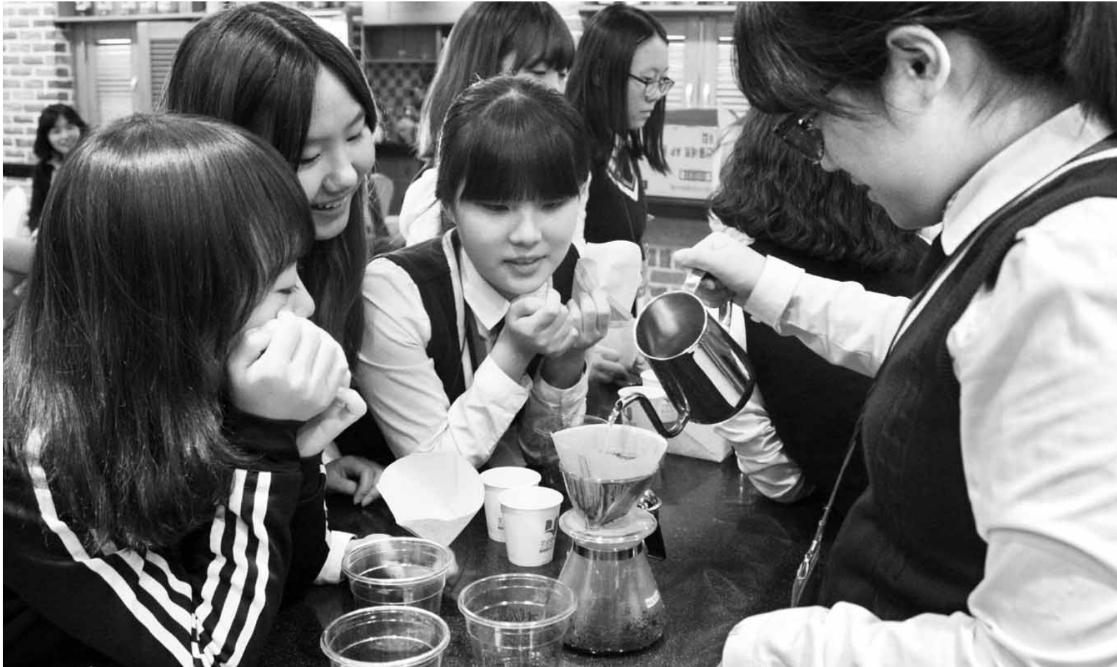
호남대 청소년 진로직업체험 캠프 인기 호남대학교(총장 서강석)가 청소년들에게 진로직업체험캠프를 운영해 큰 호응을 얻고 있다. 호남대알라딘스쿨은 오는 12월까지 총 11회에 걸쳐 광주 중·고교 학생 500여명을 대상으로 진로직업체험캠프를 실시한다. 지난 12일 광주 문정여고 학생들이 호텔경영학과 '바리스타 체험'에 참가, 직접 커피를 내리고 있다.