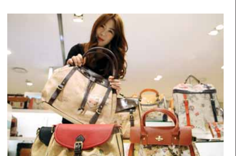
광주신세계 백화점 1층 이벤트홀에서 진행되고 있는 '핸드백 대전'에서 모델이 행사기간 5만원에 한정판매하는 '소노비' 핸드백을 선보이고 있다.