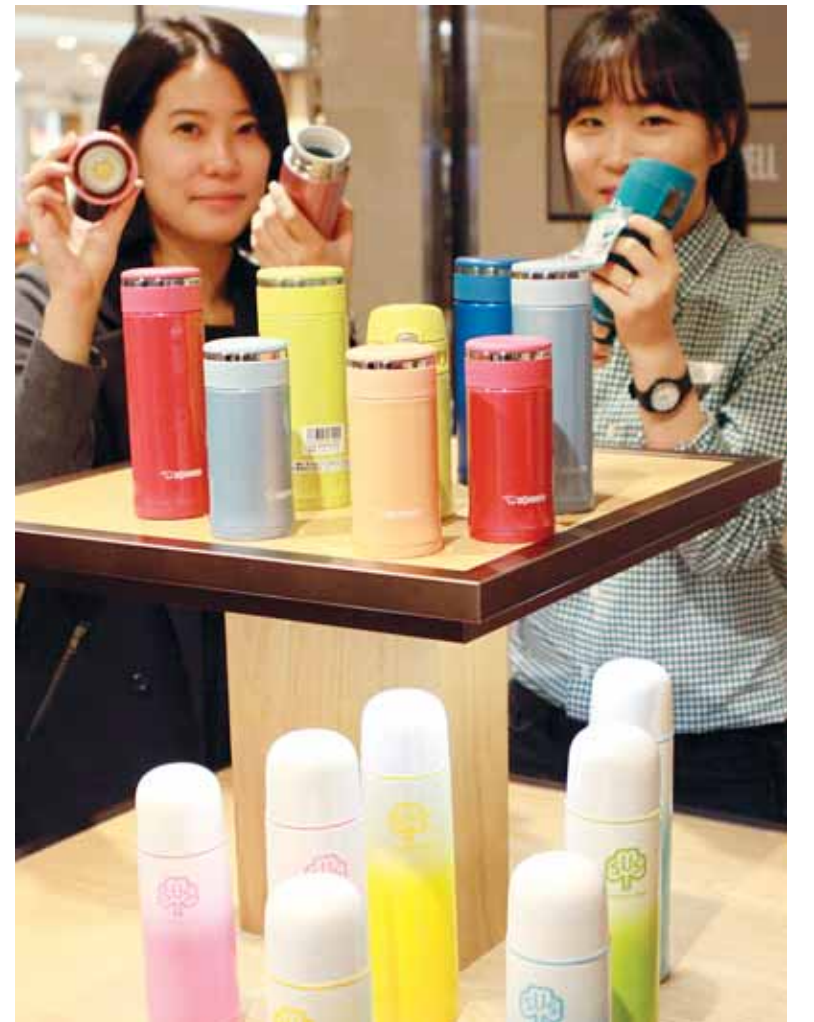
수능 앞두고 휴대하기 편한 보온병 17일 대학수학능력 시험을 3주 앞두고 롯데백화점 광주점 가정코너에 휴대하기 편하고 색상도 화려해진 보온병이 선보여 눈길을 끌었다.