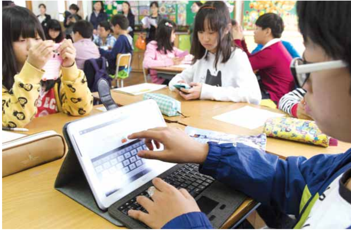
스마트폰 활용 수업 22일 디지털 교과서 정책연구학교 보고회가 열린 광주시 북구 태봉초등학교에서 학생들이 스마트폰과 태드를 활용해 수업하고 있다.