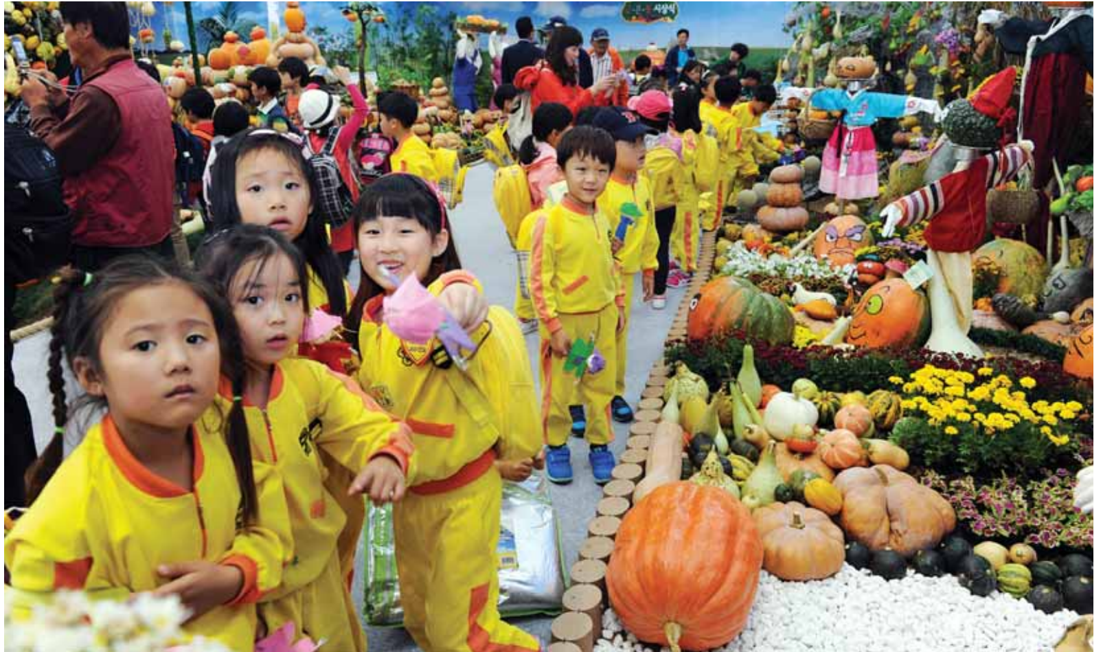
농업박람회 폐막...43만명 다녀가

진도 지산면 소포권역은 신명나는 울림마당을 주제로 9월부터 본격적인 운영에 들어갔다. 농어촌 인성학교 체험 프로그램에 참여하길 원하는 어린이집이나 학교, 단체는 해당 홈페이지를 통해 예약하면 된다. /정필수기자 bungy@kwangju.co.kr