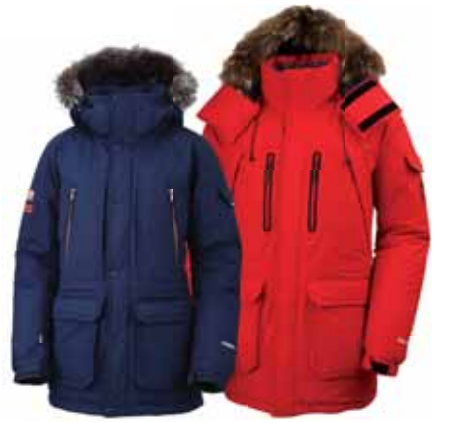
콘트라 구스 앰버 우먼 재킷 336,000원 콘트라 구스 익스퍼트 재킷 364,000원 콘트라 구스 씨미트 스톰 재킷 322,000원 퍼텍스 구스 테크 재킷 336,000원 퍼텍스 구스 트레킹 재킷 336,000원 콘트라 구스 하프 재킷 413,000원