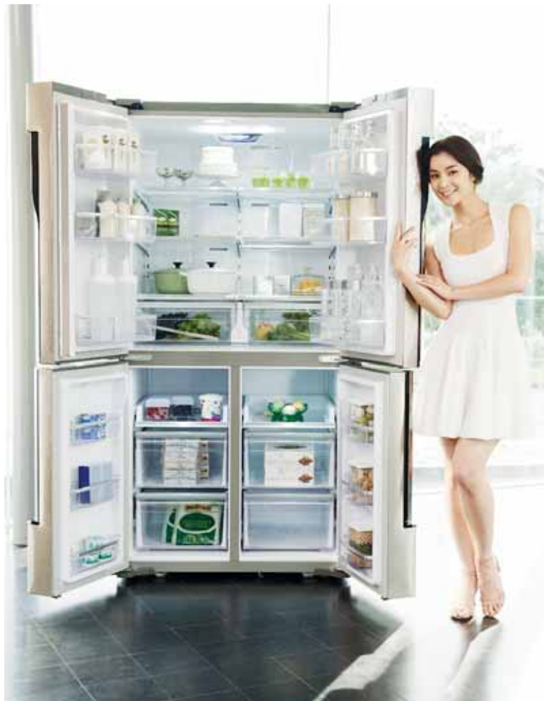
미국 컨슈머리포트의 4도어 냉장고 부문 평가에서 1위를 차지한 삼성전자 T9000 냉장고.