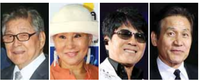
구봉서 패티김 조용필 안성기

‘가왕(歌王) 조용필(63), ‘희극계 대부’ 구봉서(87), ‘국민 배우’ 안성기(61), ‘한국 최고 디바’ 패티김(75) 등이 대중문화예술 분야의 최고 영예인 문화훈장의 은관훈장 수훈자로 선정됐다. 문화체육관광부와 한국콘텐츠진흥원은 조용필 등 은관문화훈장 수훈자 네 명과 드라마작가 김정수와 성우 이해경 등 보편문화훈장 수훈자 두 명 등 총 여섯 명을 문화훈장 수훈자로 결정했다고 10일 밝혔다. 문체부가 주최하고 한국콘텐츠진흥원이 주관하는 시상식은 오는 18일 오후 6시 서울 송파구 방이동 올림픽공원 내 올림픽홀에서 열린다. /연합뉴스