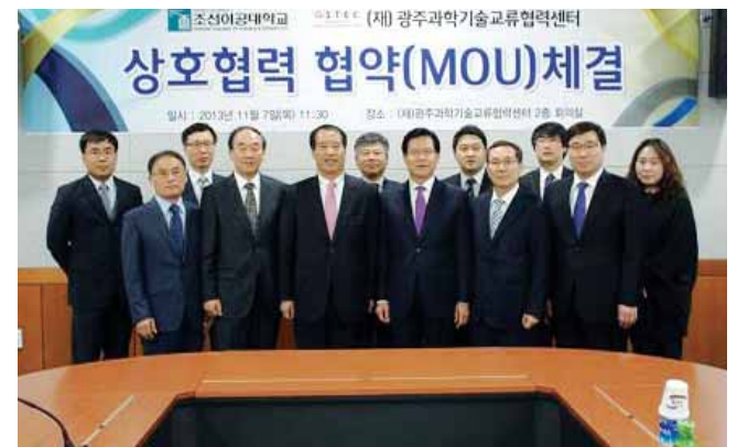
조선이공대학교(총장 김왕복)는 최근 (재)광주과학기술교류협력센터(원장 김권필)와 산학협력 협약(MOU)을 체결했다.