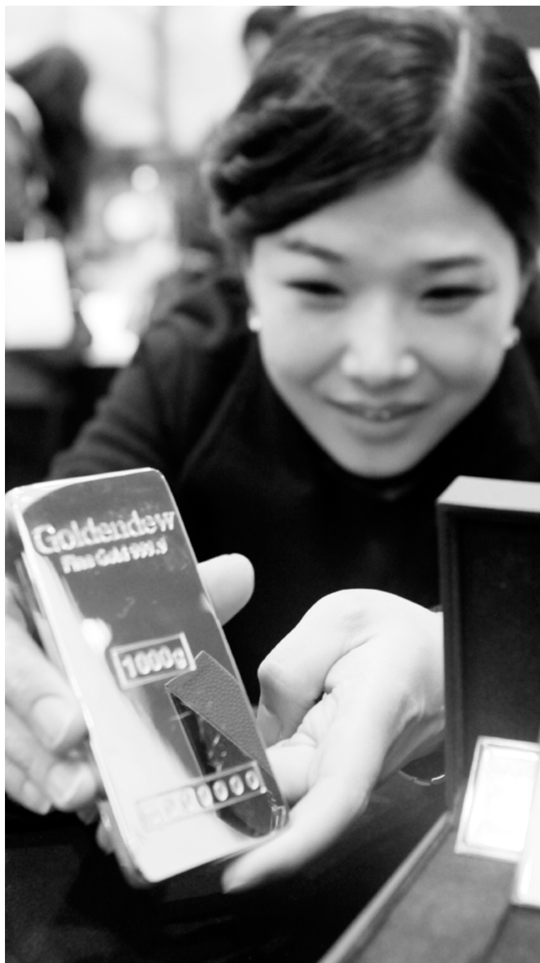
금값 하락에 골드바 인기 12일 롯데백화점 광주점 1층 주얼리 매장에서 직원이 최근 재테크와 선물용으로 고객들에게 인기 있는 1kg 골드바를 선보이고 있다. (롯데백화점 광주점)

전국 편의점, 대형마트, 업타운(UP TOWN) 카페 매장에서 만나볼 수 있다. 가격은 1200원이다. /연습뉴스