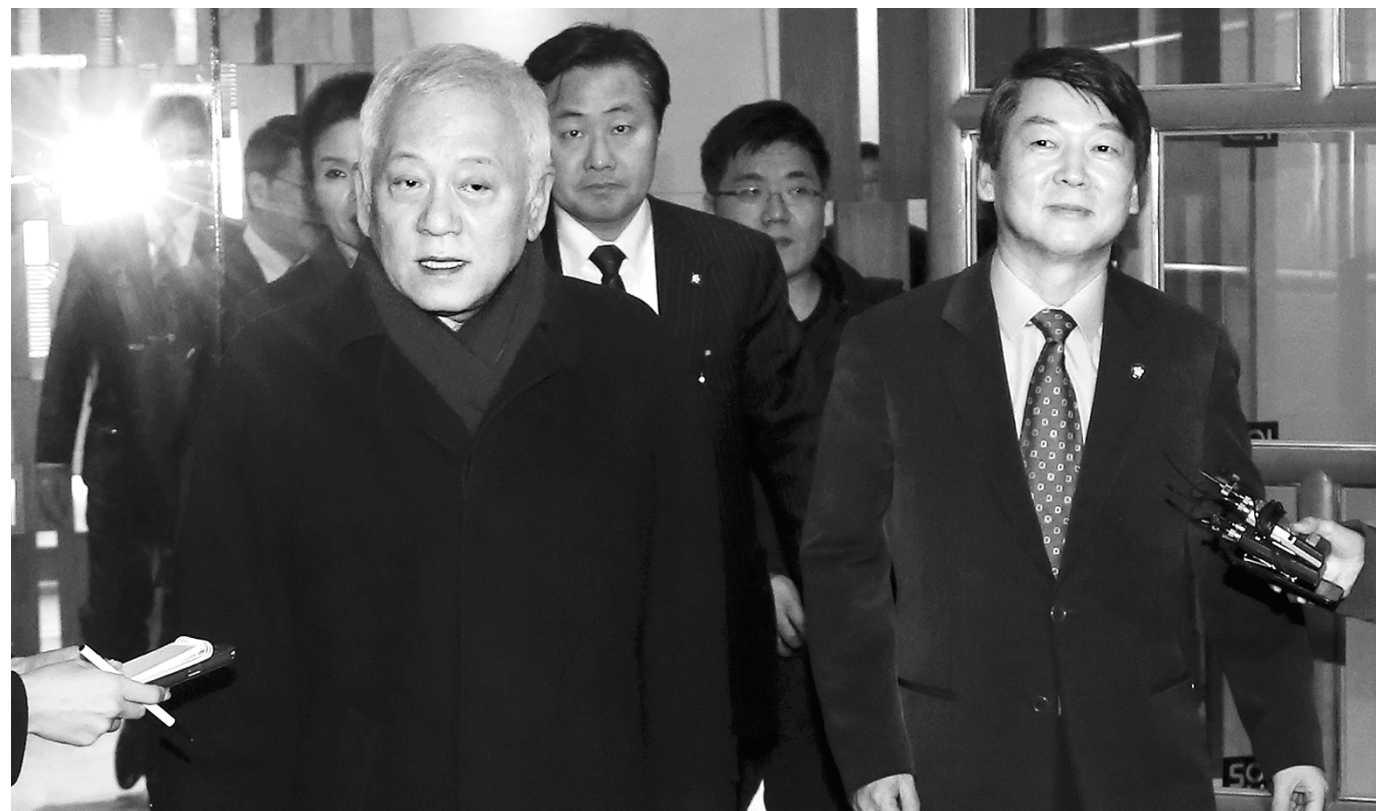
김한길 민주당 대표(왼쪽)와 무소속 안철수 의원이 24일 서울 여의도 한 중식당에서 '특검도입과 정당공천폐지' 관철을 위해 계속 협력할 것을 협의한 뒤 오찬장을 나서고 있다.