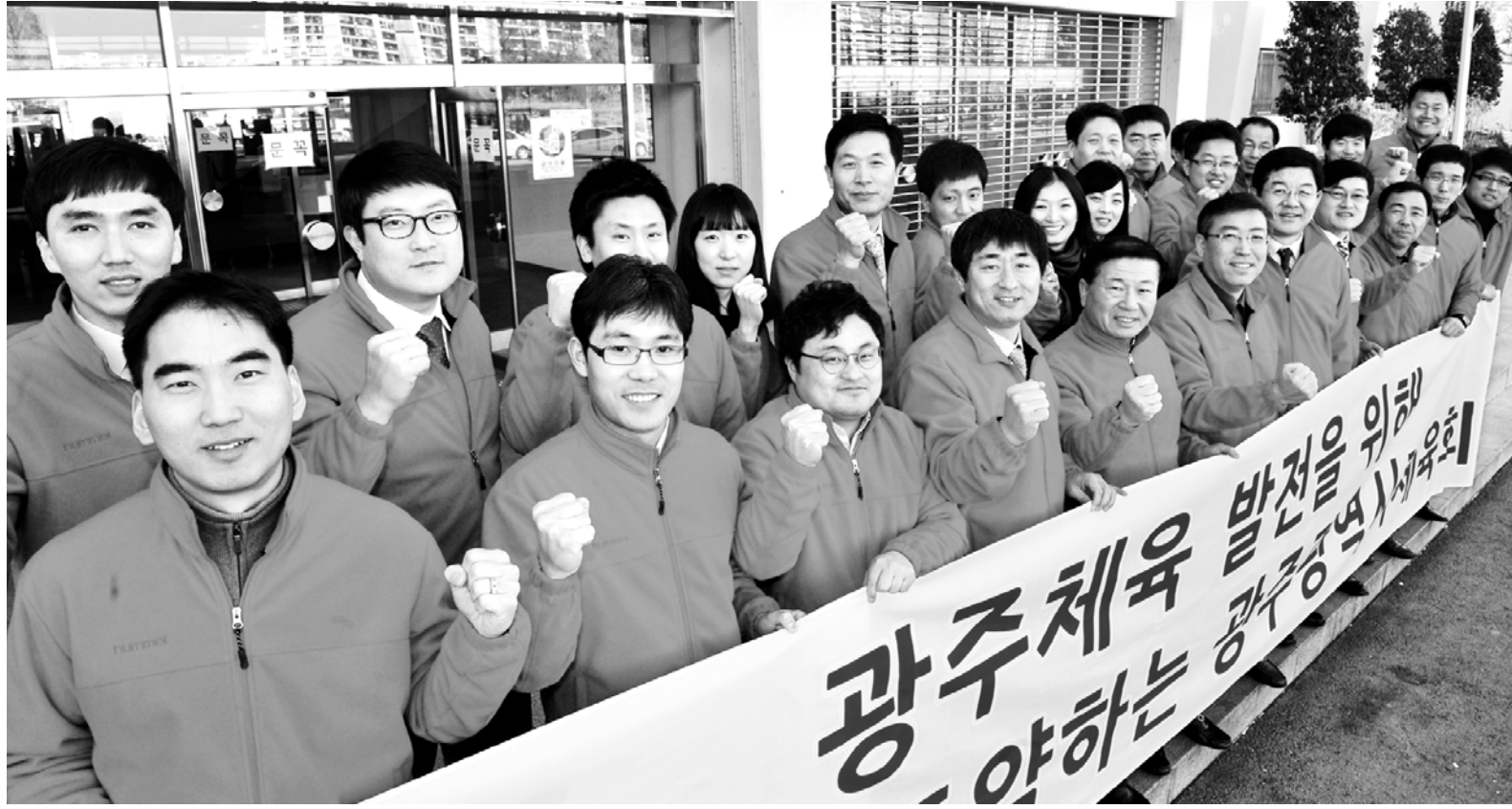
광주시 체육회 직원들이 갑오년 ‘청마(靑馬)의 해’를 맞아 7월 한-중 스포츠교류대회 성공개최와 전국체전 성적 향상을 다짐하며 화이팅을 외치고 있다.

내년 초 성공개최를 위해 U대회에 출전 또는 입상 가능한 광주 선수들을 ‘유니스타’로 선발해 지속적으로 육성하고 있다. 올해는 ‘유니스타’를 광주 지역 대학 및 대학원에 진학시