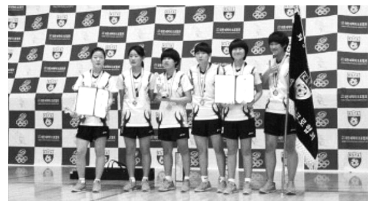
순천전자고 여자 세팍타크로팀

한편 시상식은 오는 28일 서울 올림픽파크텔 올림픽아홀에서 있을 예정이다. /송기동기자 song@kwangju.co.kr