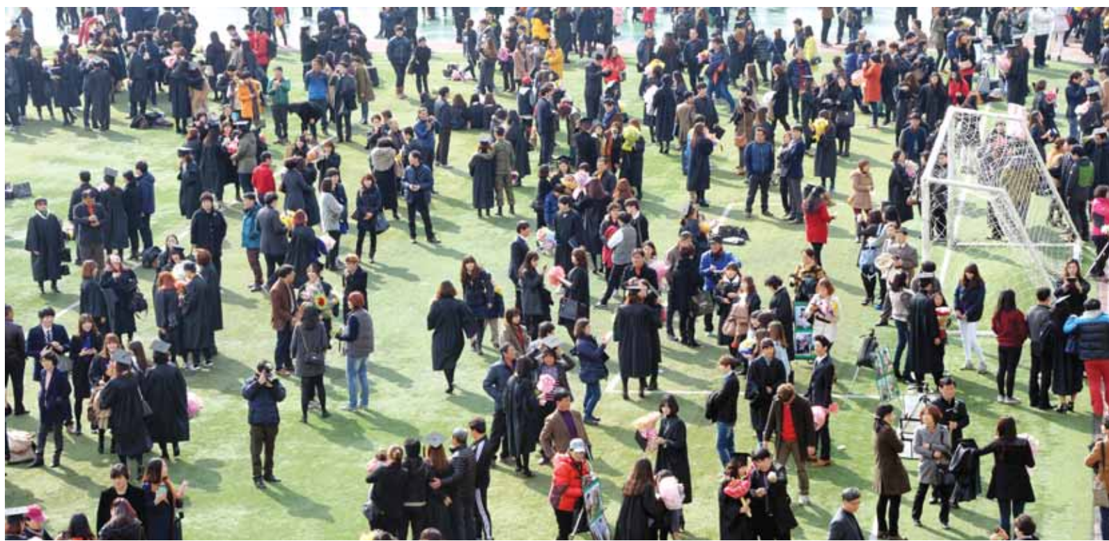
이쉬운 작별 19일 오전 광주 서영대학교에서 열린 '2013학년도 학위수여식' 이후, 졸업생들이 가족들과 교정에서 기념촬영을 하고 있다.