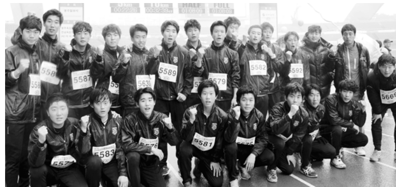
5km를 완주한 남부대 축구부 선수들이 올 시즌 선전을 다짐하는 파이팅을 외치고 있다.