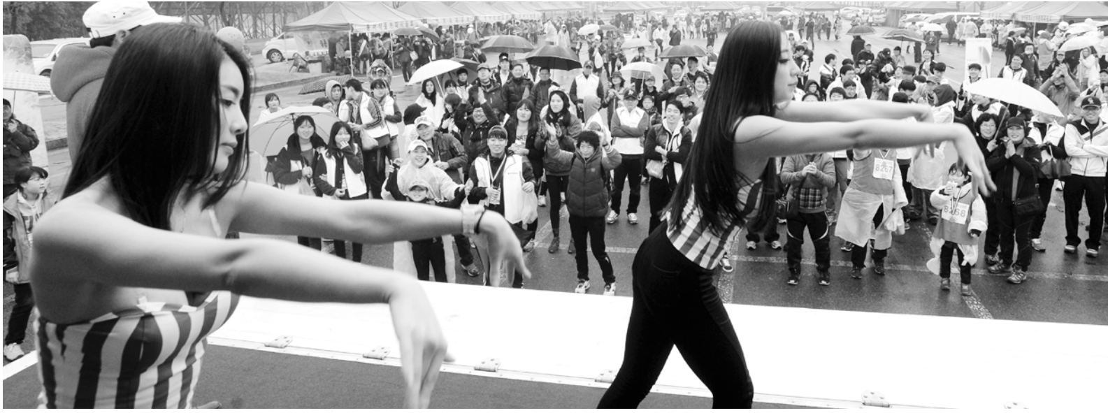
하이트진로가 준비한 이벤트 차량에서 흥겨운 음악과 댄스 공연이 펼쳐지자 시민들이 함께 호흡하며 흥겨워 하고 있다.