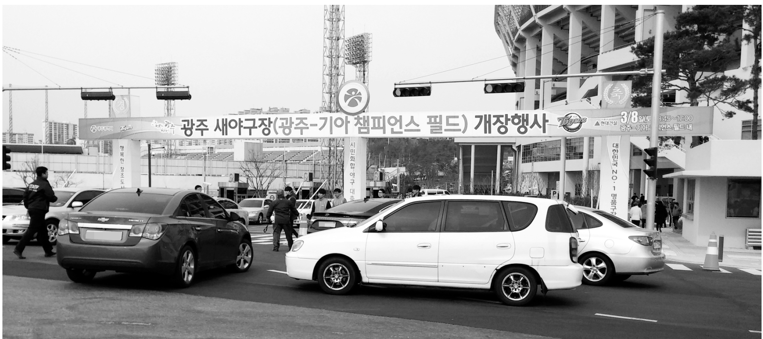
'광주-기아 챔피언스 필드' 개장식이 열린 지난 8일 광주시 북구 임동 야구장 지하주차장에 진입하려는 차들이 뒤엉키면서 이 일대 도로가 교통혼잡을 빚고 있다.

'광주-기아 챔피언스 필드' 개장식이 열린 지난 8일 오후 1시, 광주시 북구 임동 야구장 지하주차장 진출입로 앞 교차로엔 20~30대의 승용차가 사방에서 오도기도 못한 채 멈춰 서 있었다. 운전자들은 옛 광주보훈회관·옛 무등야구장·임동 주공아파트 방면에서 야구장 지하주차장(주차면 수 1116대)으로 진입하려고 했지만 차량 통제요원들이 진입을 막아섰다. 만차(滿車)가 됐기 때문이다. 주차장에 들어갔다 주차공간을 찾지 못해 다시 바깥으로 나오는 차들도 40~50m 가량 줄지어 서 있었다.