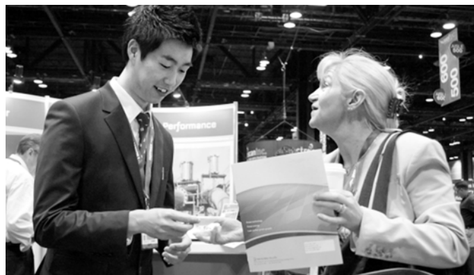
광주대 학생인턴 사원이 미국 시카고 전시장에서 글로벌마켓터로 활동하고 있는 모습.