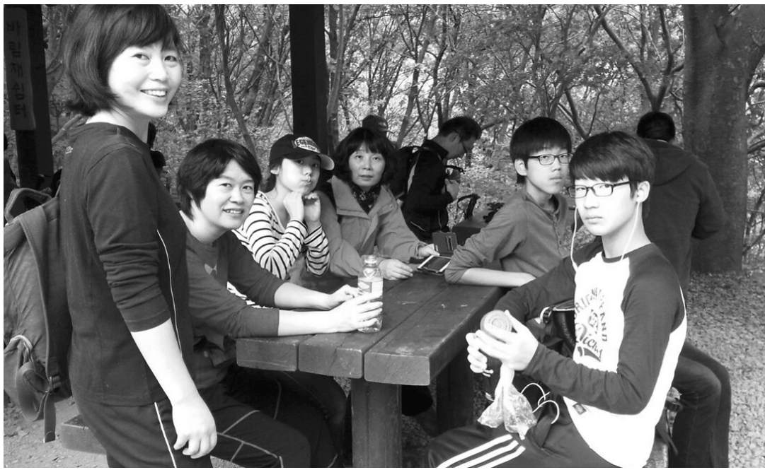
희망교실에 참여한 학생들이 담임교사·가족 등과 함께 무등산에 오르면 신뢰와 우애를 다지고 있다.