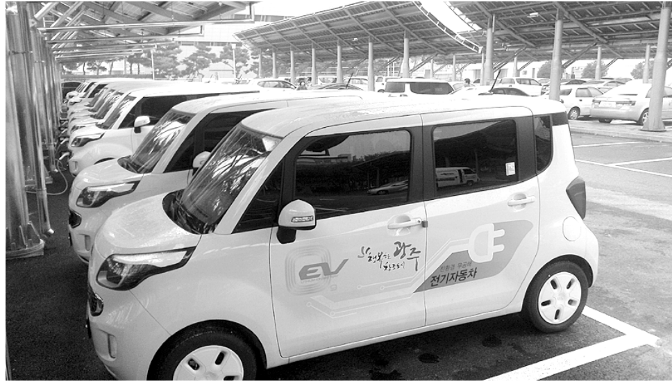
전기차 시장의 확대와 더불어 충전 인프라, 배터리 성능 향상 등 풀어야 할 숙제도 많다. 사진은 광주시가 지난해 전국 최초로 도입한 '태양광 발전 전기차 충전설비'로 심야시간에 전기차를 충전할 수 있게 만들어졌다.

24일 환경부에 따르면 지난 2011년 ▲광주 1대 ▲전남 50대에 불과했던 전기차는 2013년 ▲광주 66대 ▲전남 112대로 큰 폭으로 증가했다. 이와 함께, 불과 3년 전에는 광주에 단 한곳