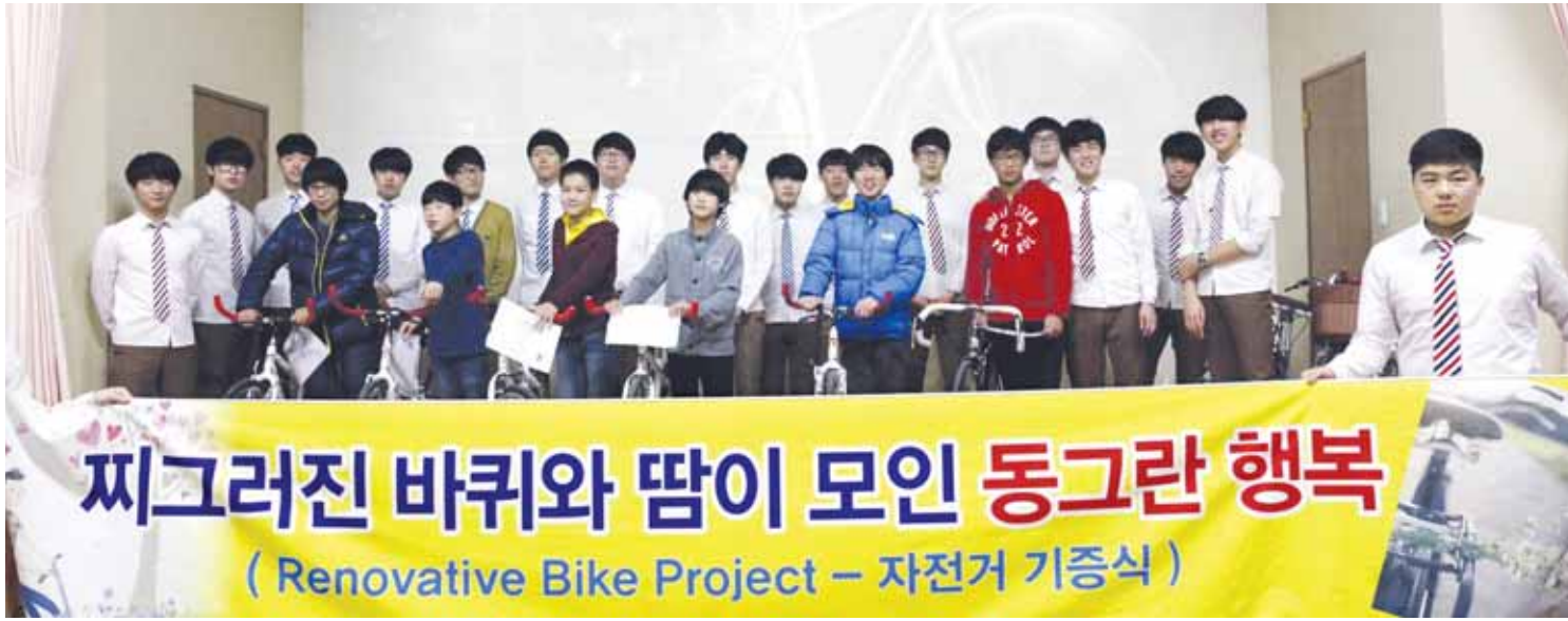
지난 29일 동구 운림동 무등육아원에서 조대부고 경제동아리 '레인메이커스' 회원들이 육아원 원생들에게 직접 만든 자전거를 기증한 후 기념사진을 찍고 있다.