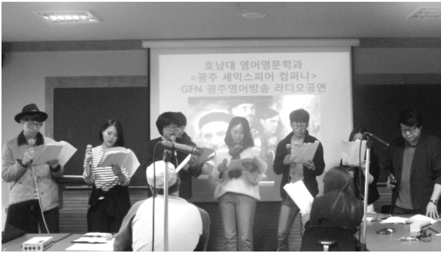
지난달 28일 호남대 영어영문학과 학생극단이 셰익스피어 희곡 '베니스의 상인'을 각색한 '베니스의 여상인'을 녹음하고 있다.