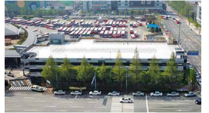
15일 개장한 금호터미널 유·스퀘어 주차장 전경.