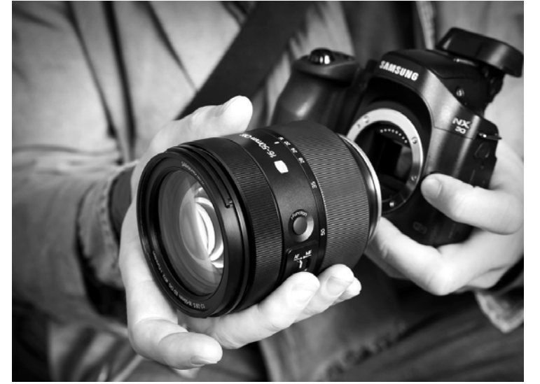
한 소비자가 삼성전자의 NX30 미러리스 렌즈교환 카메라에 16-50 렌즈를 마운트하고 있다.

삼성전자 16mm 광각~ 50mm 3배줌 다양한 화각 조리개 F2~2.8 어두워도 흔들림없어