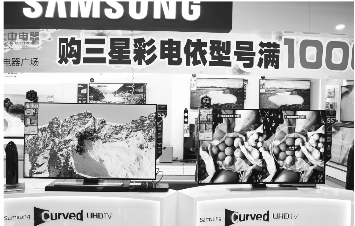
중국 베이징(北京)의 대형 전자상가 중태(中塔) 따중띠엔치(大中電器)에 입점한 삼성전자 매장 커브드(곡면) UHD TV가 전시돼 있다. 신혼부부 등 젊은층에서 많은 관심을 보인다고 매장 직원은 설명했다. /연합뉴스

(LGU+) 등의 모바일 앱마켓에서 '통신서비스 피해예방 매뉴얼'로 검색해 내려받으면 된다. 방통위 관계자는 "이 모바일 앱을 통해 국민 모두가 통신서비스 피해를 예방하고 신속하게 구제받을 수 있을 것으로 기대한다"고 말했다. /연합뉴스