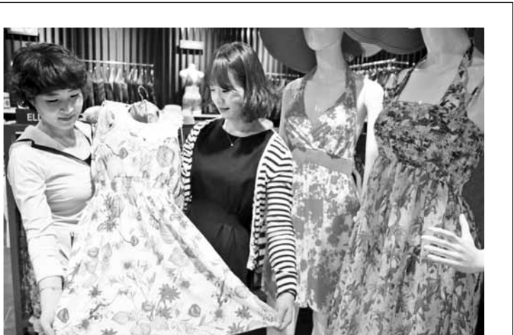
24일 광주신세계 지하 패션스트리트 수영복 매장을 찾은 고객이 비치웨어를 살펴보고 있다.

광주점은 가전·가구 교체 수요가 당분간 꾸준할 것으로 내다보고 예비 신혼부부와 신규 아파트 입주자를 타깃으로 한 이사철 맞춤 마케팅을 펼칠 계획이다. 우선 5월31일까지 입주 사전점검자를 대상으로 맞춤형 쿠폰북·핸드 빌 등을 증정한다. 또 가전·가구 등 입주 관련제품을 구매하면 다양한 혜택을 제공한다. 쿠폰북과 청첩장·입주 확인증을 함께 가져오면 할인 등도 지원한다. 롯데백화점 광주점 가정팀 관계자는 “나주 혁신도시, 첨단 2지구 등 신규 아파트가 들어서면서 어느 때보다 이사 수요가 많을 것으로 내다보고 있다”면서 “신혼부부나 새 집으로 이사하는 가족들에게 큰 혜택을 주고자 맞춤 마케팅을 준비했다”고 말했다. /김대성기자 bigkim@kwangju.co.kr