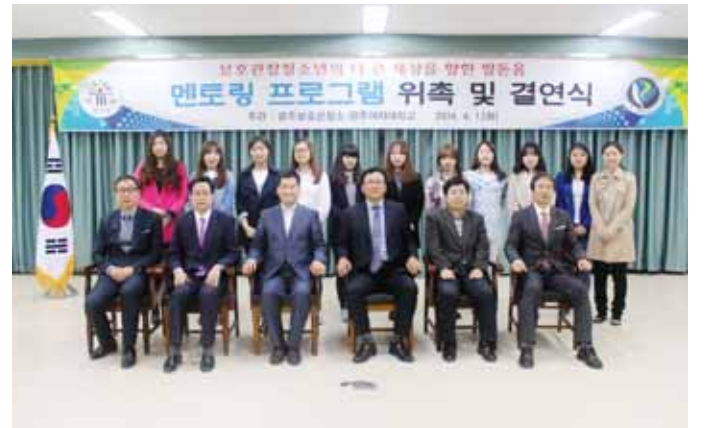
광주여자대학교(총장 이선재) 사회복지학과는 최근 광주보호관찰소 2층 무등홀에서 보호관찰소 청소년들과 결연식을 갖고, 청소년을 대상으로 한 멘토링 프로그램을 진행했다.