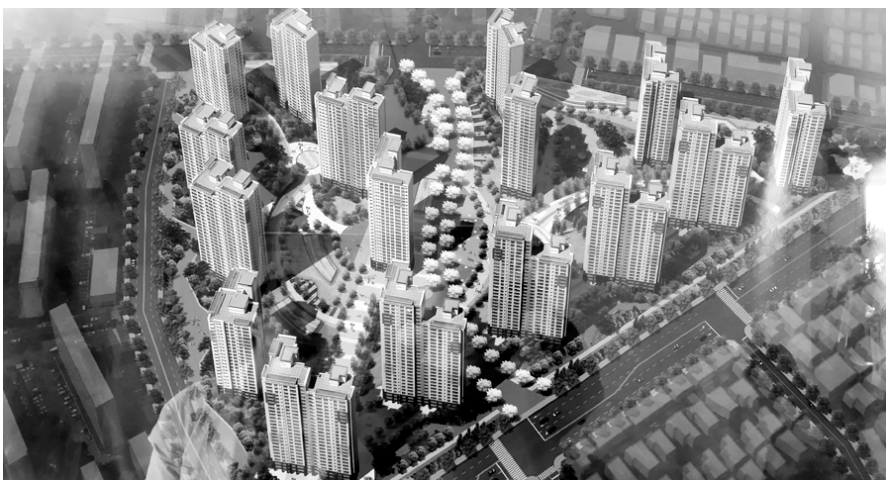
광주 염주주공아파트 재건축 예상 조합도.

조합은 용적률 상향조정도 추진하고 있다. 현재 248.96%인 용적률을 10% 범위 내에서 늘린다는 계획이다. 이렇게 되면