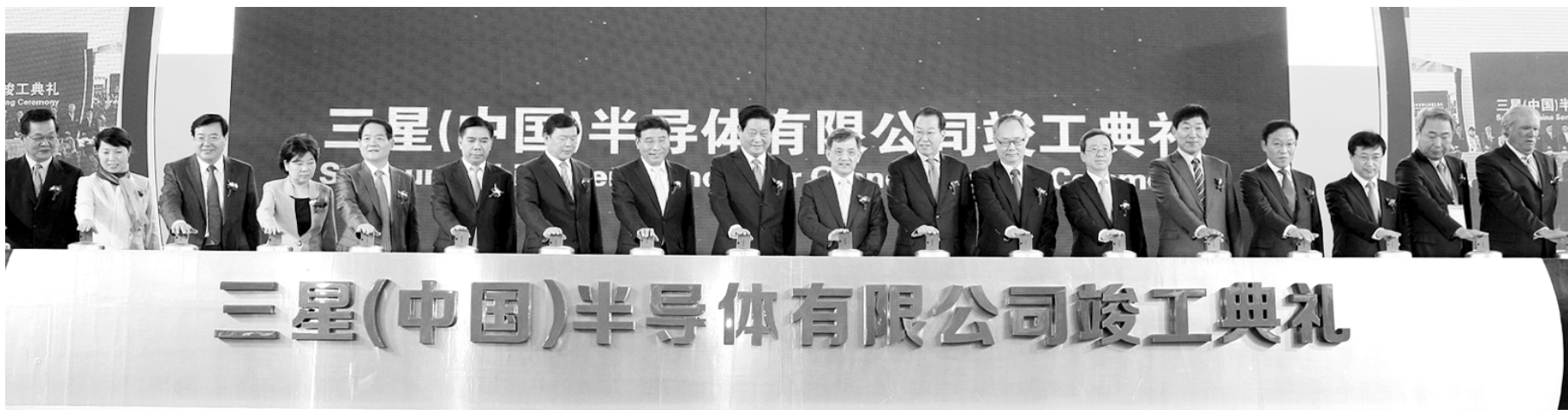
삼성전자 중국 반도체 공장 준공식