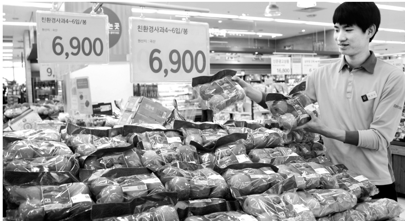
14일 광주시 서구 이마트 상무점 과일코너에서 직원이 3~4개 단위로 소포장한 과일을 판매하고 있다.

유통업계 한 관계자는 "고물가와 이상기온에 과일 가격이 상승하자 정상 과일을 상대적으로 적게 구매하고, 소포장 상품을 사거나 가격변동이 적은 견과일이나 냉동과일을 선호하는 추세"라며 "이에 따른 유통업계의 소포장 판매나 흡집 과일 할인 판매 열기는 당분간 지속할 것"이라고 내다봤다. /김대성기자 bigkim@kwangju.co.kr