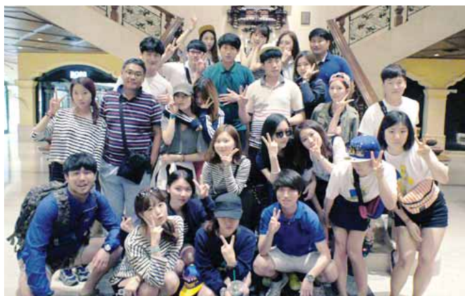
호남대학교 호텔경영학과(학과장 이희승)는 최근 2·3학년생을 대상으로 홍콩, 마카오 해외 산업시찰을 실시했다.