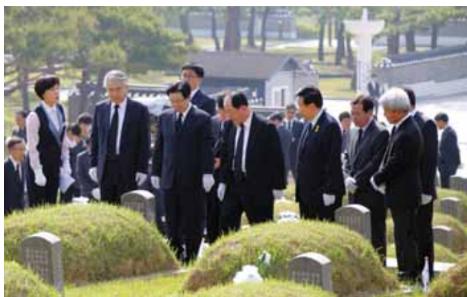
전남대 지방문 총장을 비롯한 대학 본부 보직자·교수·학생·동문 등 100여 명은 최근 대학본부 국제회의실에서 5·18 34주년 기념식을 가진 뒤, 국립 5·18민주묘지를 참배했다.