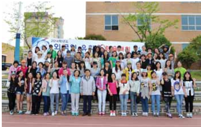
광주여자대학교(총장 이선재) 대외협력처는 최근 교내 천연잔디운동장에서 광주여대에 재학중인 외국인 유학생 간 화합과 단결심을 높이기 위한 체육대회를 가졌다.