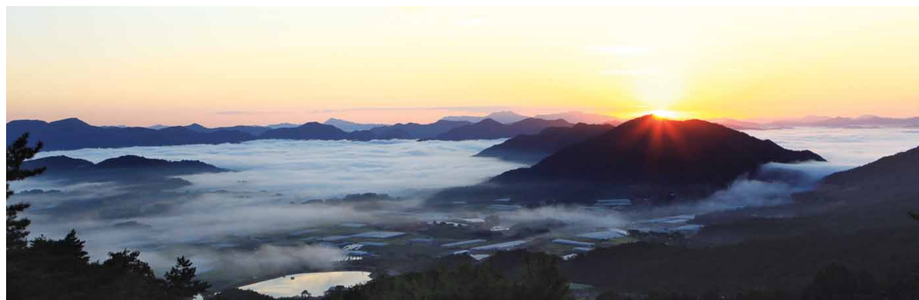
옥천 용암사의 운무위로 솟아오른 일출.