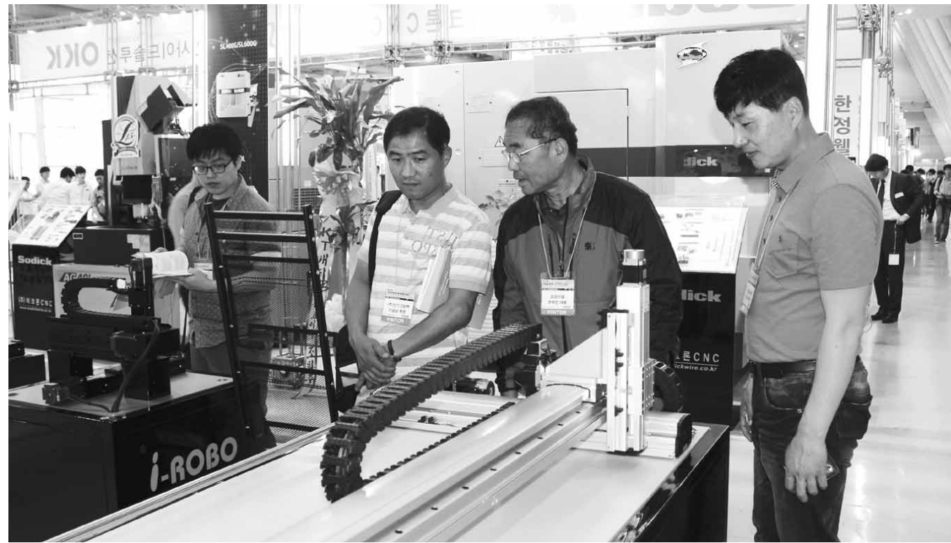
21일 경남 창원컨벤션센터에서 열린 '2014 창원 국제자동화정밀기기전' 행사장에서 금호타이어와 지역 협력사 임직원들이 참가업체를 둘러보며 신기술을 체험하고 있다.

이런 상황에서 전체 물량의 10% 정도만 거래되는 도매시장에서 기준가격이 결정되다보니 시장상황을 제대로 반영하지 못하고 있다는 지적이 제기되고 있다. 거래 물량이 적다 보니 물량이 1~2%만 변해도 가격이 큰 폭으로 출렁이기 때문이다. 나머지 90%는 육가공업체에 도축되고 있으며, 육가공업체는 양돈농가와 돼지고기 가격을 적용한다. 따라서 양돈 농가들이 도매 시장 대신 육가공업체에 돼지고기를 공급할 경우 도매시장 공급물량은 늘지 않기 때문에 높은 가격이 유지되고 양돈농가들은 그만큼 높은 가격을 받을 수 있게 된다. /김대성기자 bigkim@kwangju.co.kr