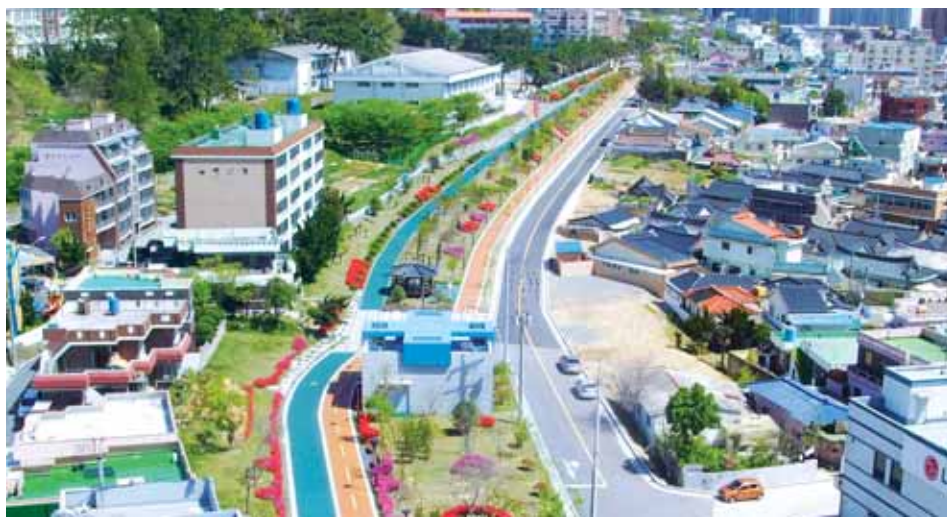
철도 폐선부지 공원은 구도심과 신도심을 연결하는 통로역할 뿐만 아니라 접근성이 뛰어나 출퇴근과 등하교 길로 활용도가 매우 높다.

◇석현공원 6월말 준공 앞뒤=이밖에 석현 공원(길이 1165m)은 2013년 12월 착공해 오는 6월말 준공을 앞두고 현재 마무리 공사가 한창 진행 중이다.