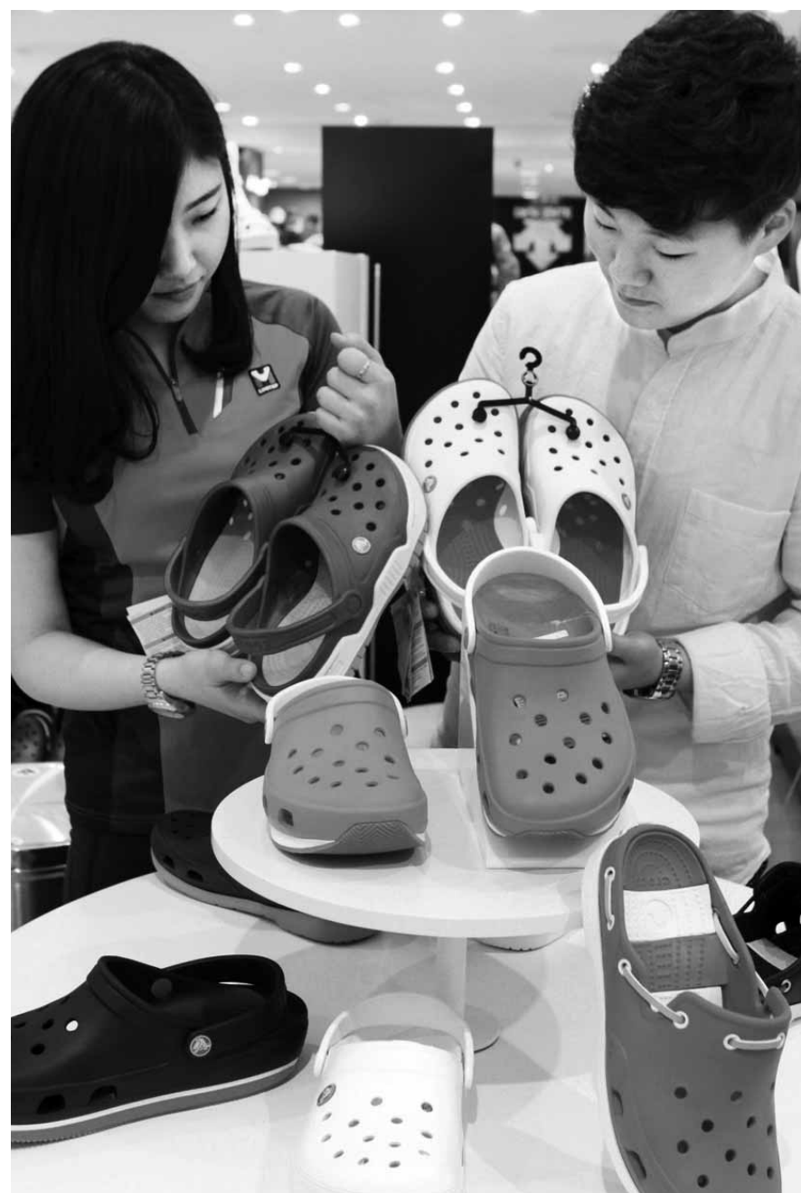
"바캉스 시즌 온다" 아쿠아 슈즈 인기 롯데백화점 광주점 5층 신발 매장에 다양한 디자인 형형색색의 아쿠아 슈즈가 선보였다. 바캉스나 장마로 인해 물에 젖을 일이 많은 여름철에는 패션과 실용성을 모두 갖춘 아쿠아 슈즈가 인기가 높다. <롯데백화점 광주점>

전남에선 코리아카본, 지에스칼텍스, 금호폴리켄 등 합자법인이 많은 여수가 가장 넓은 면적의 외국인 소유 토지를 보유하고, 이어 광양과 해남, 무안, 순천 순이었다. 해남은 법인이 아닌 외국국적 교포가 조상으로부터 증여받은 토지 600필지가 몰려 있었다. 광주지역 외국인 소유 토지는 344만 5000㎡로, 외국인 소유 토지 면적의 1.5%를 차지했으며 토지가액은 4012억원에 달했다. /임동률기자 exian@kwangju.co.kr