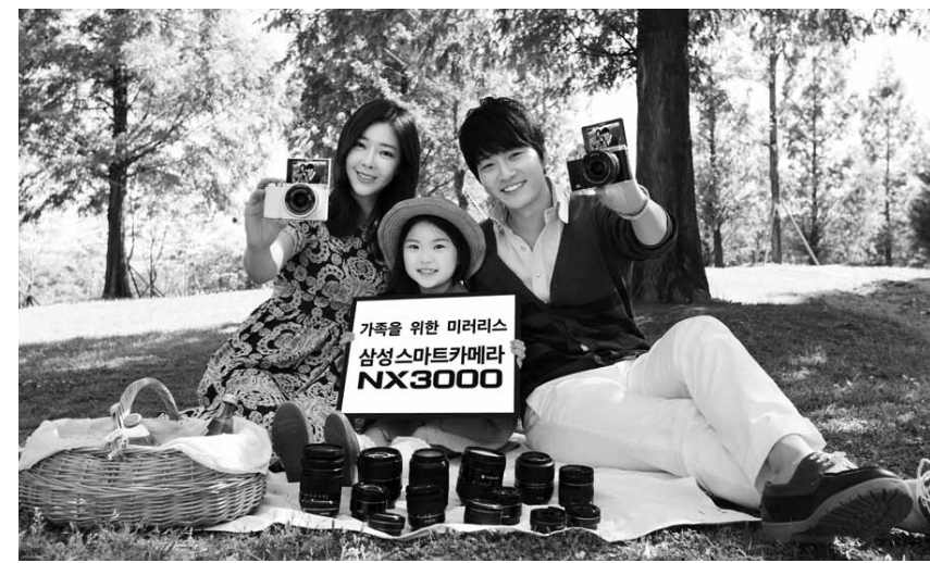
현대 편리한 삼성 스마트 카메라 28일 서울 평화의 공원에서 삼성전자 모델이 새로 출시된 '스마트 카메라 NX3000'을 소개하고 있다. 신제품은 삼성전자가 가족 단위의 야외 활동과 여행이 늘어나는 여름 성수기 시즌 공략을 위해 내놓은 카메라로, 고성능 DSLR급 화질에 편리한 휴대성을 갖췄다.