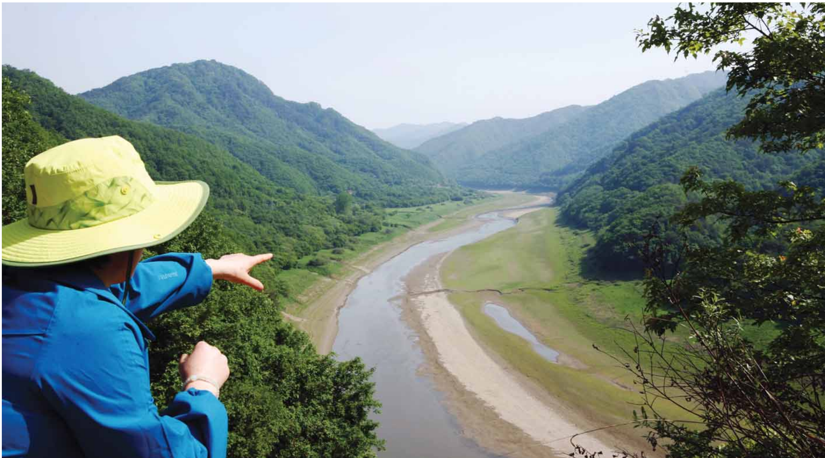
강원도 양의대 습지 전망포인트