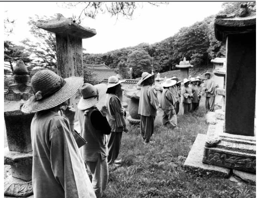
미항사 템플스테이 프로그램 중 하나인 부도전 참배.

주요 프로그램은 몸과 마음의 청정을 목표로 매일 6시간씩 진행되는 참선수행과 수행론, 미항사 주지 금강 스님에게 화두 수행, 미항사 주지 금강 스님에게 화두 간택, 좌선, 육조단경 등을 배우는 법문, 매일 수행을 보고하고 조언을 듣는 수행 무단, 전통 작살차를 직접 행다(行茶)해서 마시는 다도 등으로 구성돼 있다. 또 오후불식(午後不食) 프로그램이 있