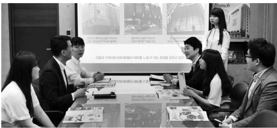
9일 롯데백화점 광주점 3층 회의실에서 백화점 마케팅 실무 담당자와 대학생 마케터들이 토론을 진행하고 있다.