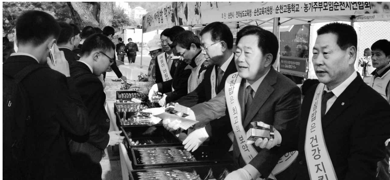
지난 4월 농협전남지역본부 임직원들이 순천고에서 등교하는 학생들에게 김밥과 음료를 나눠주고 있다.