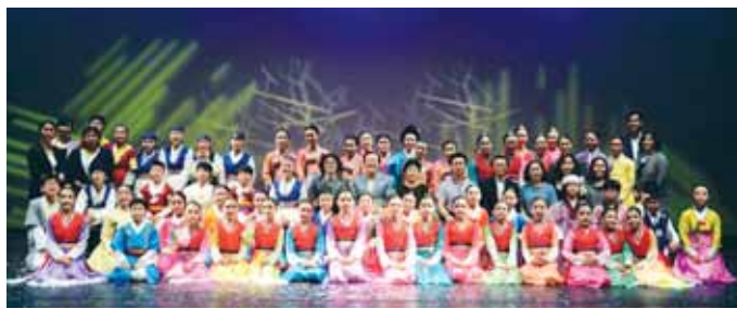
지난 14일 목포시민문화체육센터에서 전남도립어린이국악단 창단 9주년 기념 무료 정기공연 '희망을 품고 떠나는 여행'이 열렸다.