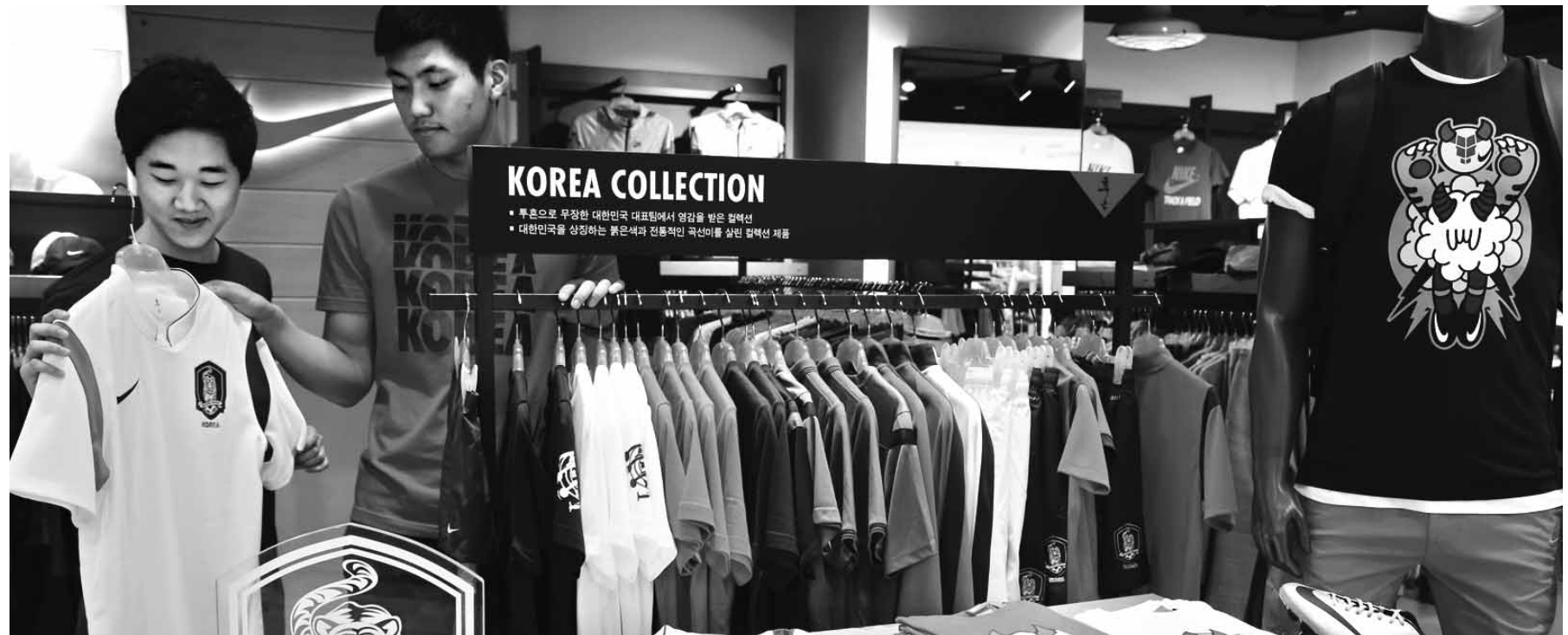
월드컵 열기... 국가대표 유니폼 인기

은 필요하지만 방향과 구체적인 방법에 대해서는 민간이 주도하도록 배려해야 한다고 지적한다. 충장으로 알리기 사업을 진행하고 있는 류동훈 행복문화사업단 단장은 "변화의 방향이 이렇다면 광주를 대표하면서 꿈과 낭만을 간직할 이야기가 있는 거리가 되으면 한다"고 밝혔다. 그는 또 "계획을 갖고 개발했지만 무분별해지면서 향락만 판치는 '유흥 천국'이 된 상무지구의 전철을 밟아서는 안 된다"며 "민과 관이 머리를 맞출 협의체를 구성, 올바른 방향을 모색하는 것도 방법"이라고 말했다. 한편, 이곳에서 가까운 구시청 사거리는 동구청이 국립아시아문화전당 개관에 맞춰 '아시아 음식문화지구' 조성을 계획하고 있어 맛집촌으로서 역할과 함께 새로운 문화공간으로서의 성공 여부도 주목된다. /김대성기자 bigkim@kwangju.co.kr