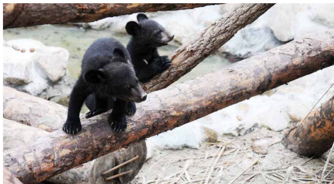
구례군에 위치한 국립공원관리공단 종복원기술원 자연 적응 훈련장에서 최근 발견된 새끼 반달곰 2마리가 나무에 올라 놀고 있다.