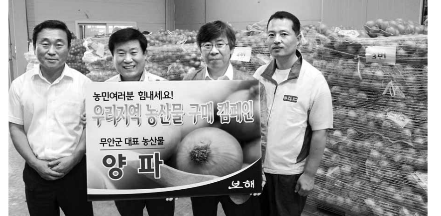
지난 4일 보해 직원들이 광주시내 음식점을 돌아다니며 양파 전달 및 소비촉진을 위한 홍보활동을 펼치고 있다.

한편 전국적인 여성 고용률은 증가세를 유지해 지난해 평균 50.2%로 작년 같은 달 보다 0.5%포인트, 전월보다는 0.3%포인트 각각 올라, 사상 처음으로 50%를 돌파했다.